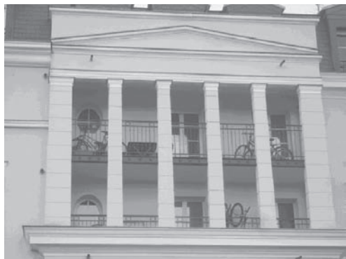
Nouveau logement avec 4 vélos au balcon chez Pas de Calais Habitat à St-Laurent-Blangy

L'article 12 des PLU (Plans Locaux d'Urbanisme) reprend les normes en matière de stationnement vélo pour les immeubles neufs. Aujourd'hui, cet article est dépassé de par les normes appliquées (insuffisantes), mais aussi de par l'absence de normes sur la qualité des parkings à vélos réalisés. En général, beaucoup de PLU ne reprennent comme norme que 3 m 2 par immeuble ou pour 2-3 logements alors qu'il faudrait au minimum un emplacement vélo par appartement. C'est pourquoi, il est fréquent de voir des vélos parqués sur les balcons des nouveaux immeubles sociaux ou privés. La preuve donc que le stationnement des vélos n'a pas été pensé avant la construction. Or l'on sait qu'il est extrêmement difficile de modifier les immeubles après construction.