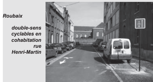
Roubaix double-sens cyclables en cohabitation rue Henri-Martin