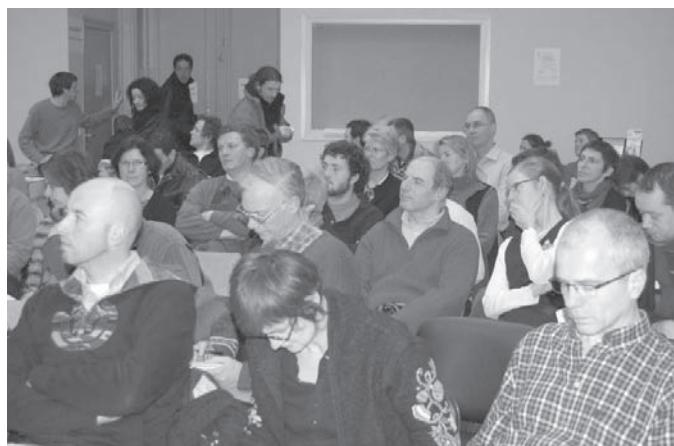
Chaque année les adhérents viennent un peu plus nombreux

Au 31 décembre 2008, l'ADAV comptait précisément 1216 adhérents, soit une augmentation de 9% en un an.