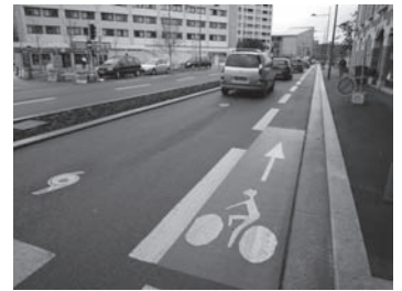
bandes cyclables rue d'Havre

rues : de la Gare, Jacquard, Girard, Papin, Buttin, Soupis, Lamartine, de Lattre de Tassigny, Foch, St Charles, Kennedy, du Moulin, Macé, Jeanne d'Arc, St Pierre et Curie. Bondues : l'ADAV demande que le projet de piste bidirectionnelle du Chemin St Georges soit relié aux projets de pistes du département sur la RD 617. M. Anceau.