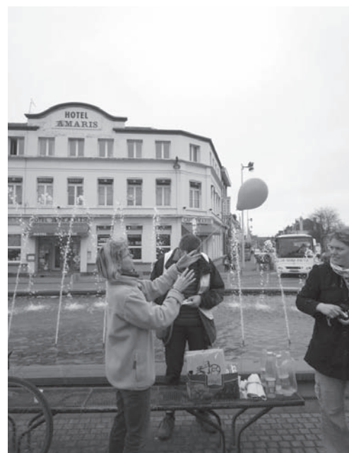
Le lacher de ballon

remis aux participants, ceci non seulement pour marquer le caractère festif de cette sortie, mais aussi pour symboliser le fait que les ballons, qui sont toujours prisés par les enfants, parcourront Béthune en attendant que ses enfants puissent le faire eux-mêmes, à vélo et en sécurité, grâce aux futurs aménagements cyclables.