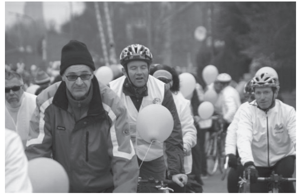
Chaque participant est muni d'un ballon

pour aller d'une bordure à l'autre. D'autres enfants roulent librement un peu plus loin. Entre les conseils que leur prodiguent leurs parents, leur casque mal ajusté qui leur tombe sur un œil et les mouvements de leur ballon gonflé attaché à leur monture, les écarts de conduite ne sont pas rares. C'est le propre des enfants d'être distraits et c'est bien leur droit non ! Pour ceux qui sont installés tranquillement sur le siège bébé du vélo de leur père cela n'a aucune importance. J'en vois même un qui commence un petit pique-nique avec la rondelle de saucisson donnée par le boucher chez qui ils ont lu l'affiche annonçant la balade.