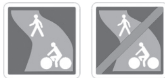
La nouvelle signalisation.

On peut rencontrer des voies vertes aussi bien en milieu urbain (par exemple les cheminements véloroutiers, à Lille, des plaines Winston Churchill et de la Porterie), en milieu interurbain (par exemple les berges des Bois-Blancs à Lille ou les cheminements du parc du Héron à Villeneuve-d'Ascq), ou en milieu rural (par exemple le chemin de halage du canal de l'Esperre ou l'ancienne voie ferrée Comines-Warneton).