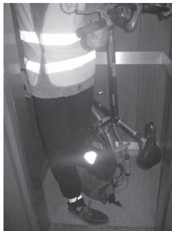
Transport d'un vélo dans un ascenseur de 4 places

Faute de locaux vélos/poussettes sécurisés et spacieux, les vélos sont entreposés sur les balcons des immeubles. Monter son vélo au 3 e étage par l'escalier ou l'ascenseur (en le mettant verticalement) n'incite pas les locataires à utiliser le vélo comme moyen de déplacement. L'accès au vélo est alors inégalitaire. Faute de stationnement vélo sécurisé, le public défavorisé n'a pas accès au vélo comme mode de déplacement quotidien.