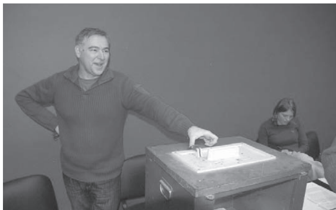
Le moment d'exercice de démocratie au sein de l'association : le vote pour l'élection du conseil d'administration

Le Grenelle de l'Environnement a fait naître quelques espoirs d'une meilleure prise de conscience de la nécessité de repenser nos modes de déplacements, et a fixé plusieurs orientations intéressantes dans ce sens. Il ne faudrait pas que les difficultés économiques et financières actuelles soient une occasion pour s'en détourner ; il faut plus que jamais investir dans la mobilité douce et les transports collectifs (davantage créateurs d'emplois et surtout de liens sociaux), plutôt que ressortir paresseusement des cartons des projets enterrés de tronçons d'autoroutes, ou, sans davantage d'imagination, alléger