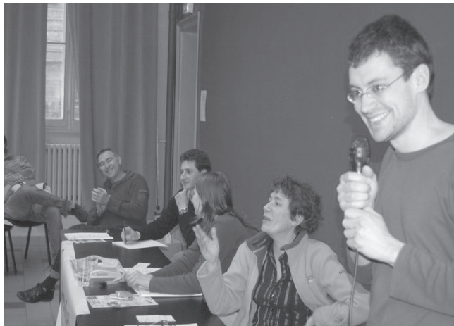
L'association nantaise « Place au vélo » invitée à l'AG pour présenter leur Fête du Vélo