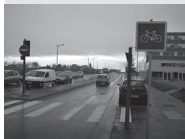
Rd 48 prise en compte des cyclistes dans le réaménagement du carrefour de l'Epi de Soil à Loos

28 mars : Visite sur le terrain des rues Potier et Foch à Loos pour évaluer les besoins, puis des rues Hegel, av de Bretagne/av de Dunkerque à Lille/Lomme et av de l'hippodrome à Lambersart. : comparaison des différents aménagements réalisés, en particulier du traitement des carrefours réussis ou non... Visite des rues Joffre, Galilée et son prolongement et du sentier de la citée de la renaissance en préparation à la réunion à la mairie. Réunion à la mairie sur le projet d'aménagement de la rue Joffre au droit de l'opération « Coats/Pollet/Lesage » envisagée par CMH. P. Coquerelle.