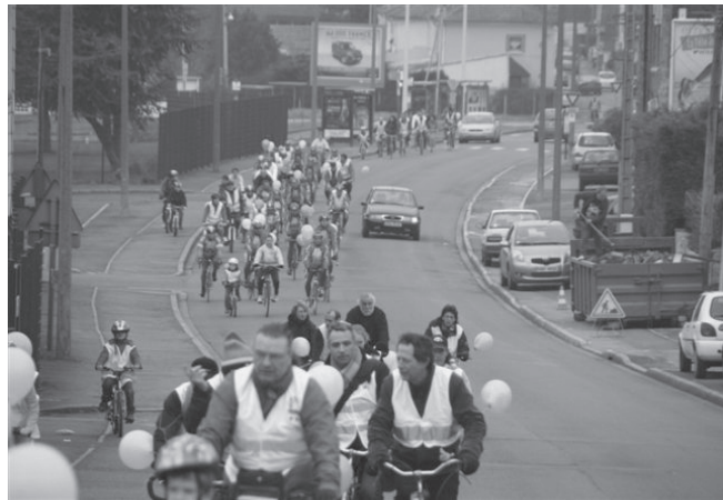
Un long cortège coloré fait route vers la gare