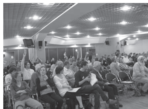
Chaque année les votes sont l'objet de vifs débats dans l'assemblée