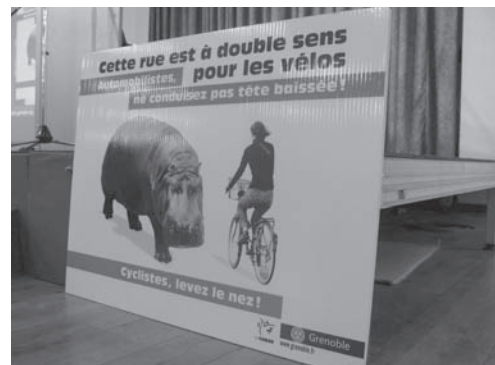
Campagne d'affichage mise en place par la Ville de Grenoble en faveur des double-sens cyclables

Hubert Falco a déjà reçu en 2008 un « Ticket rouge » décerné par la Fédération nationale des usagers des transports (FNAUT). Toulon est la plus grande agglomération française sans métro ni tramway.