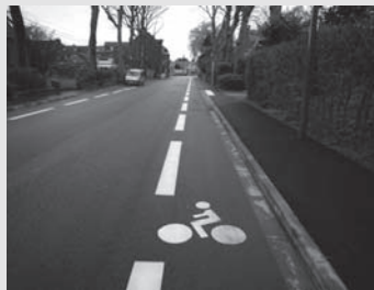
bandes cyclables rue Montalembert