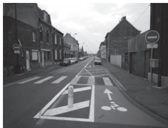
Roubaix double-sens cyclable en bande rue de Leers

15 avril : GTV : Les double-sens des rues de Leers et Boucher de Perthes sont réali-